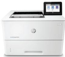
HP LaserJet Managed E50145dn

Impressora habilitada para segurança dinâmica. Somente para uso com cartuchos que utilizam um chip original HP. Os cartuchos com chips que não são HP podem não funcionar, e aqueles que funcionam hoje podem não funcionar no futuro. http://www.hp.com/go/learnabouthsupplies